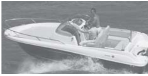
Cap Camarat 6.5 WA