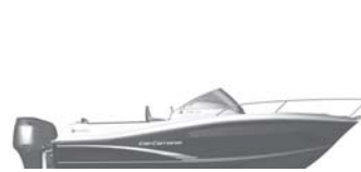
Cap Camarat 7.5 WA