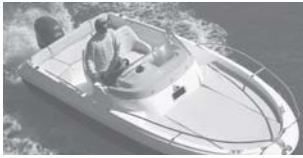
Cap Camarat 5.5 WA